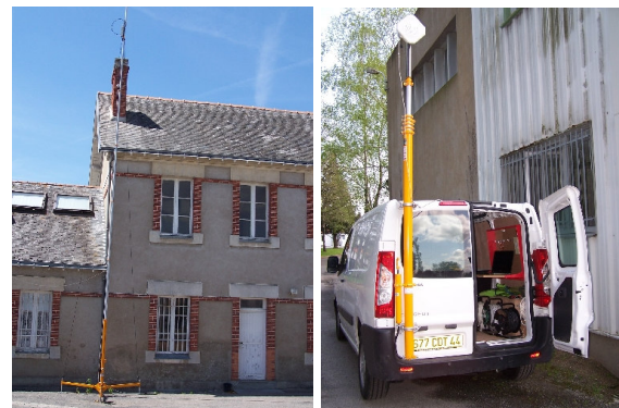
Mât sur trépied ou sur véhicule avec atelier embarqué

Pour la réalisation d'essais terrain, AWIS dispose de mâts télescopiques de 10m d'élévation au sol.